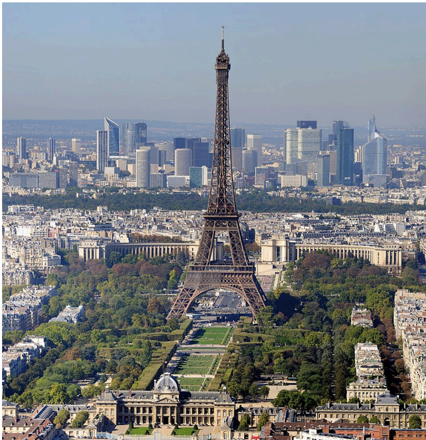
Paris, une métropole d'importance mondiale.