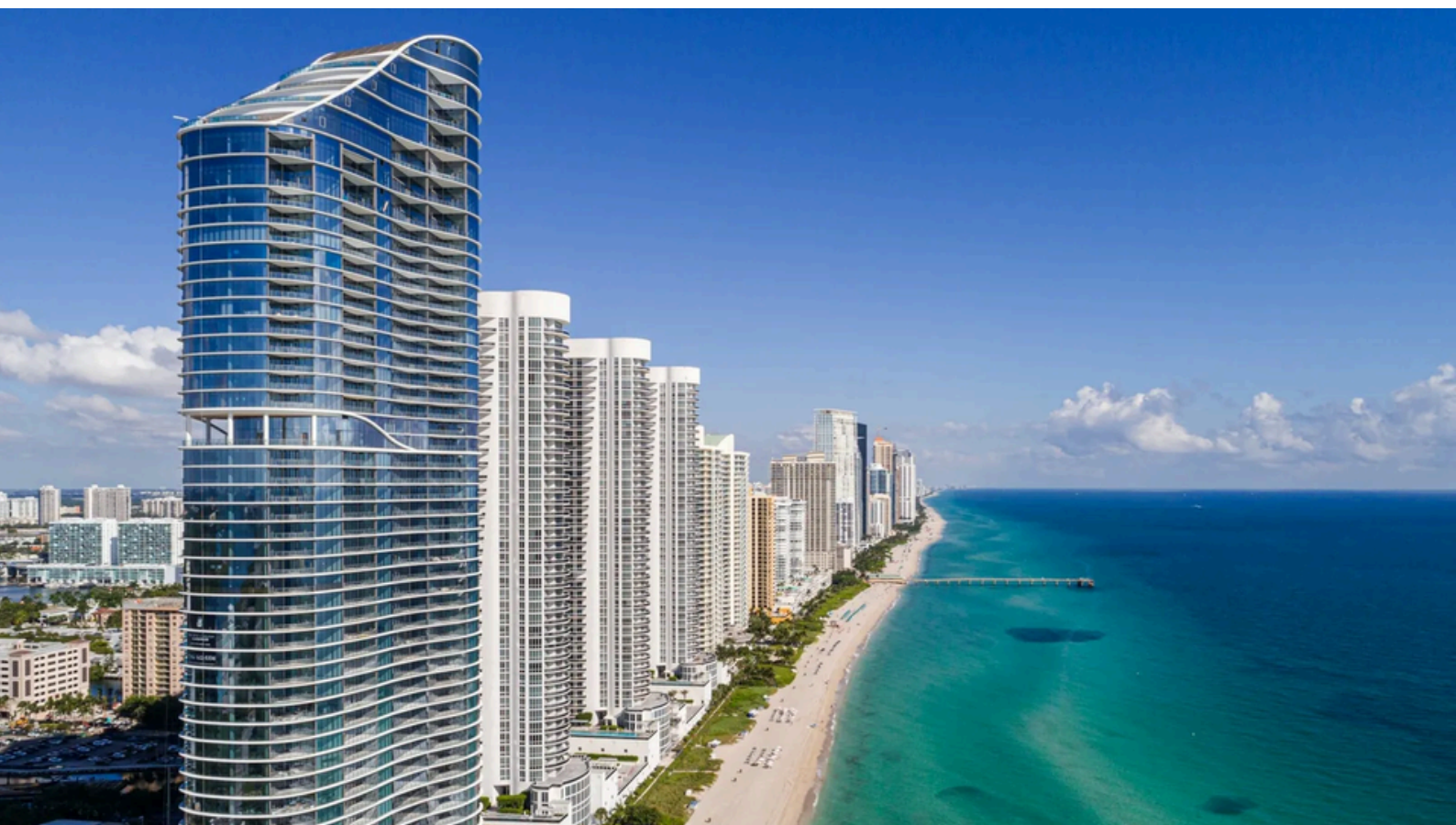
Miami Beach, un littoral humanisé