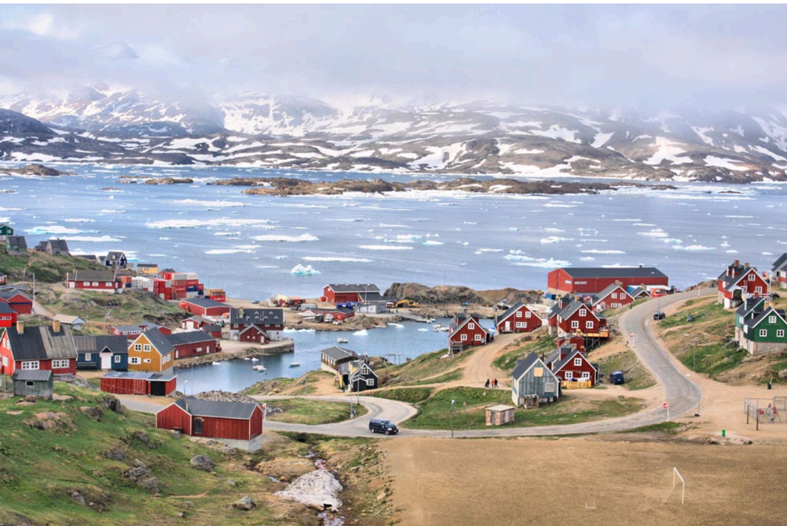
Une photographie de Tasiilaq en été