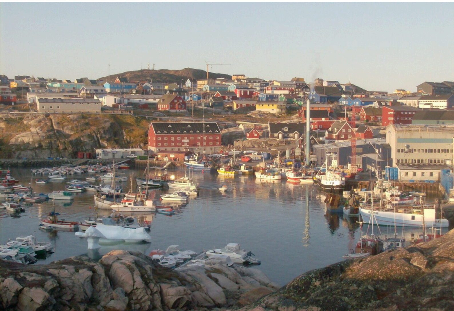
La vieille ville d'Ilulissat (Ville au Groenland) et le port depuis le fjord glacé.