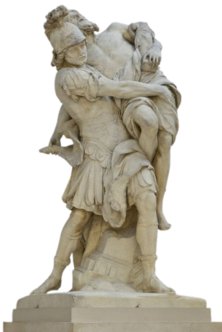
Énée portant son père Anchise lors de la fuite de Troie. Sculpture de Pierre Lepautre, 1697.