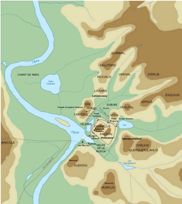
Rome dans les premières années de sa fondation au VIII e siècle av. J.-C