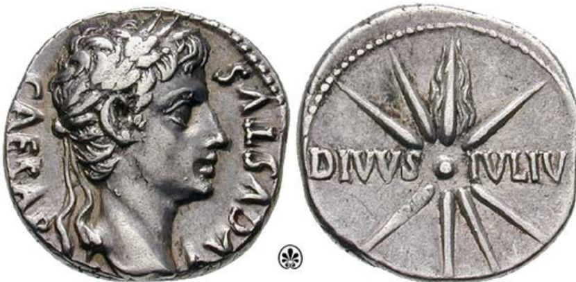
Denarius avec le profil d'Octave à l'avant et la représentation d'une comète à huit branches au revers, avec la mention DIVVS IVLIV[S].