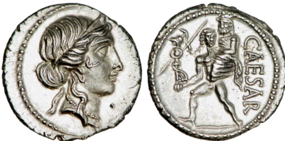
Denier frappé sous César célébrant l'ascendance divine de la gens Julia. Au droit, tête de Vénus à droite. Au revers CAESAR avec Enée debout à gauche, portant le palladium dans la main droite et portant Anchise sur son épaule gauche (Crawford, Roman Republican Coinage, 458/1).