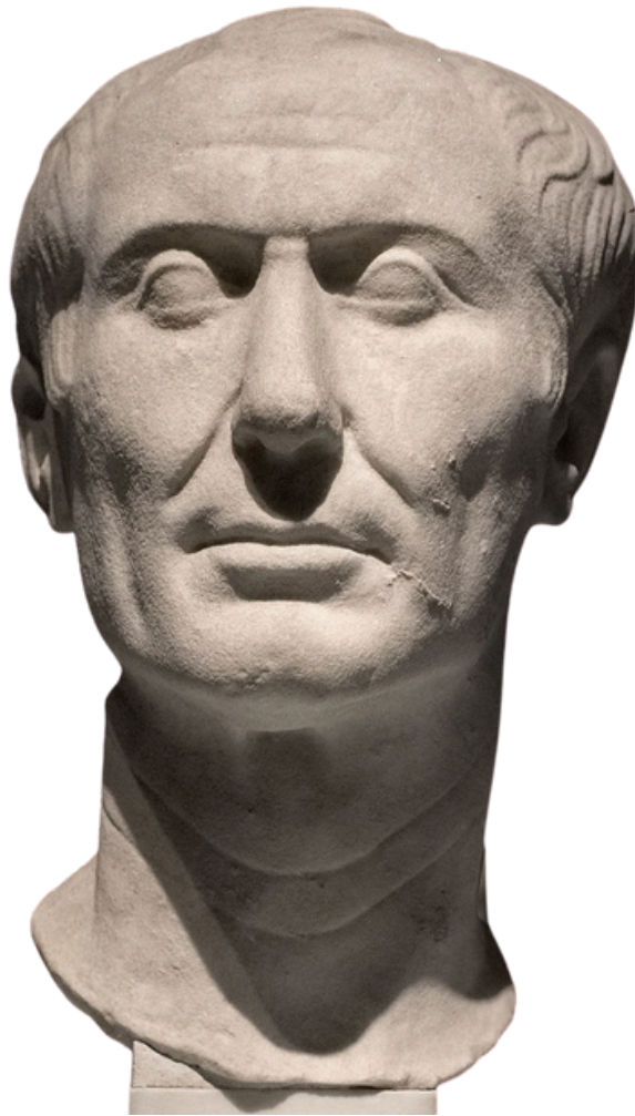
Le portrait de Tusculum, l'un des deux portraits acceptés de Jules César, trouvé par Lucien Bonaparte à Tusculum.