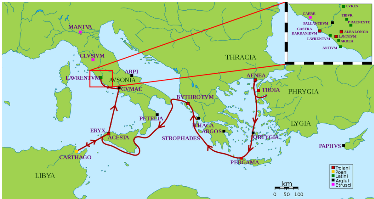
Carte du voyage d'Énée.