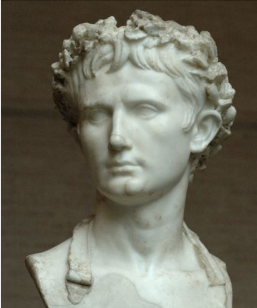
« Auguste Bevilacqua ». Buste de l'empereur portant la couronne civique, époque de son règne.