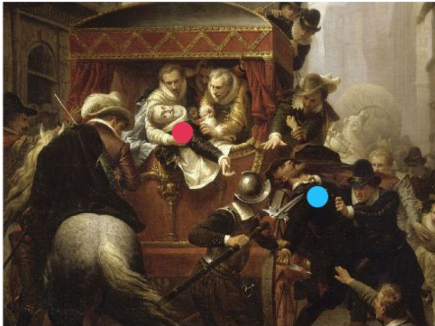
● Henri IV ● François Ravillac