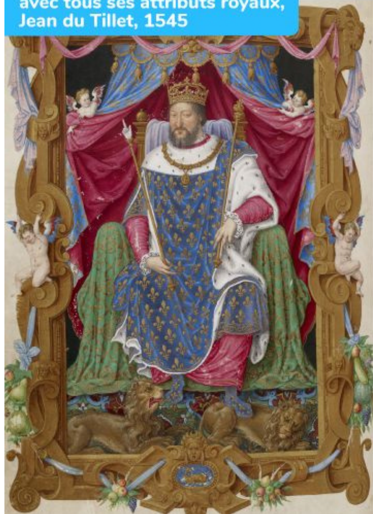
François Ier en tenue de sacre, avec tous ses attributs royaux, Jean du Tillet, 1545