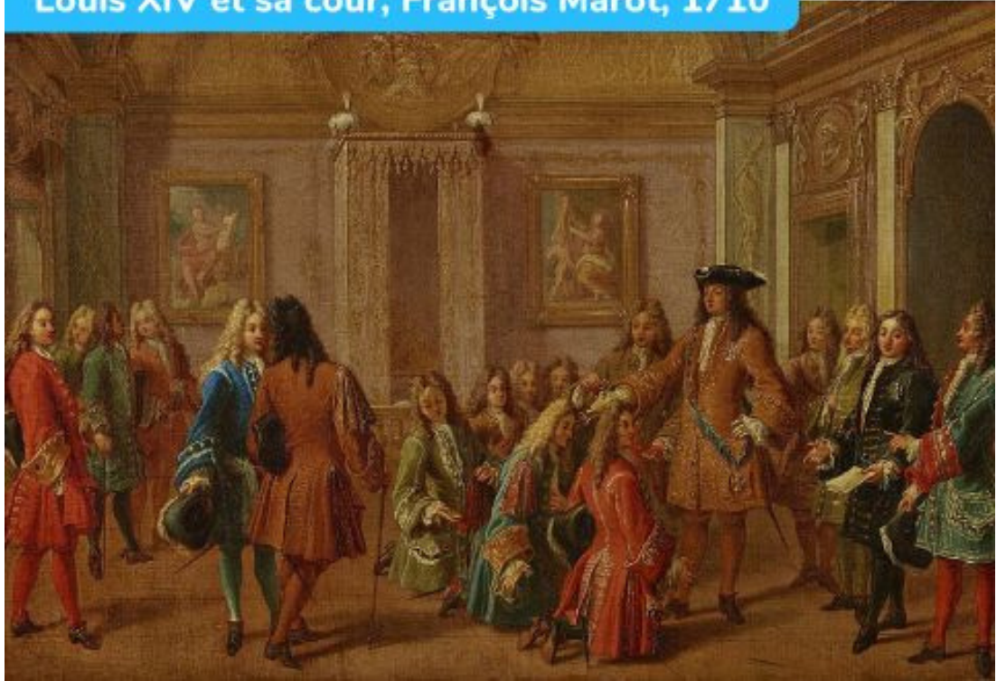
Louis XIV et sa cour, François Marot, 1710