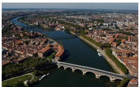
N° ..... La Garonne traversant Toulouse.