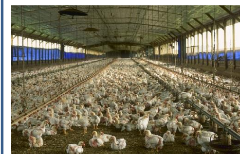
N° ..... Élevage de poulets en Bretagne