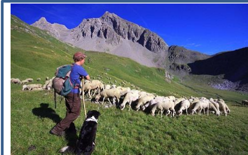
N° ..... Élevage de brebis dans les Alpes