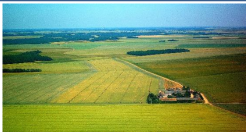
N° ..... Culture céréalière en Beauce, près de Paris.

À placer à l'intérieur de la copie. Ne pas inscrire de signe distinctif sur l'annexe (nom, signature...).